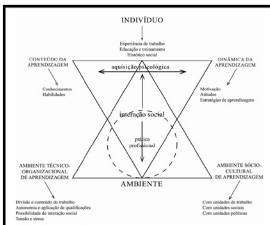
Figura 1. Representação esquemática do modelo teórico de aprendizagem no trabalho proposto por Illeris (2011).

A seta vertical interliga a aquisição psicológica do indivíduo (representada pela seta horizontal) ao ambiente da prática profissional, representado na base do triângulo inferior da mencionada Figura.